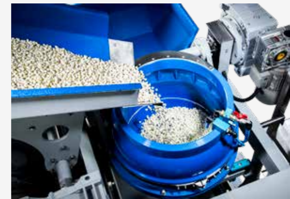
TE 60 A 2-Chargensystem mit Separiereinheit