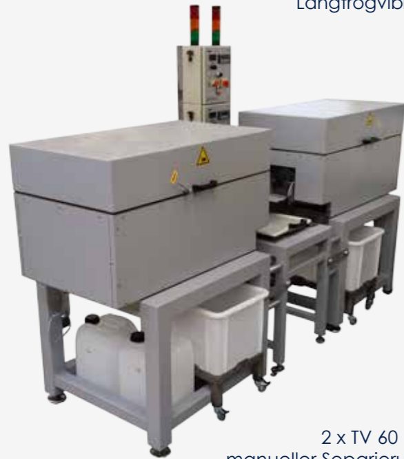
2 x TV 60 mit manueller Separierung