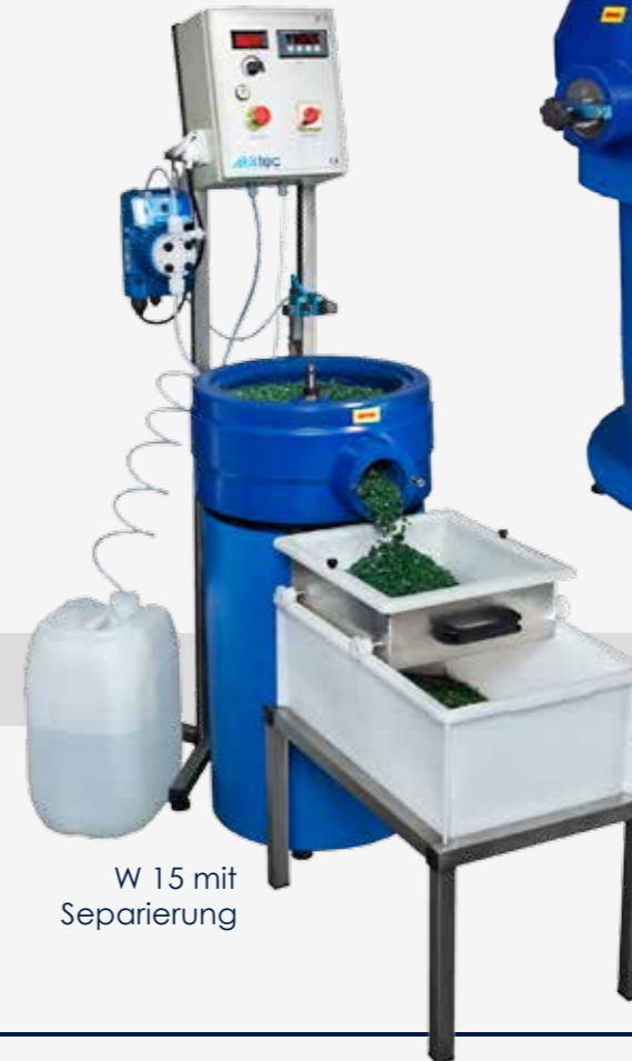
W 15 mit Separierung