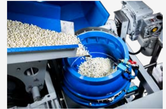
TE 60 A 2-Chargensystem mit Separiereinheit