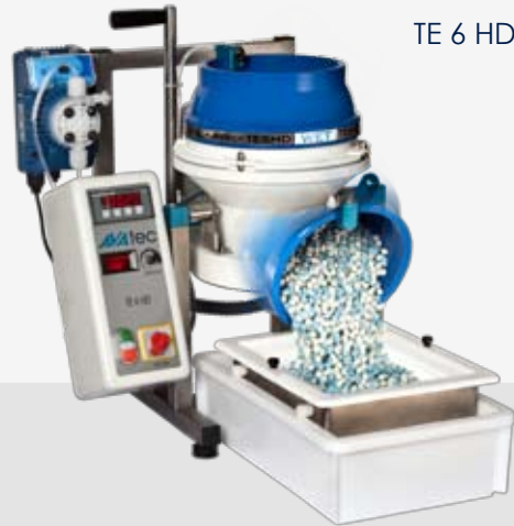
TE 6 HD

Werkstücke und Schleifmittel werden lose in einen oben offenen Arbeitsbehälter gegeben und durch den als Teller ausgebildeten Boden in eine torusförmige Strömung versetzt. Die Zentrifugalkraft beschleunigt die Werkstücke zusammen mit den Schleifkörpern an die stehende strömungsgünstige Innenwand des Arbeitsbehälters. Aufgrund ihrer unterschiedlichen Dichte führen Werkstück und Schleifkörper dabei eine Relativbewegung aus. Diese dynamische Strömung ermöglicht einen hohen, gezielten Materialabtrag mit sehr kurzen Bearbeitungszeiten im Vergleich zu Vibratoren oder Trommeln.